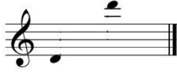
المدى الصوتي لآلة المرونة

هى السطاوية نفسها فى الشكل والتركيب، وقد يطلق أحيانا اسم مقرونة على السطاوية نفسها؛ فالمقصود بهذه التسمية هو كل الآلات الشبيهة بالسطاوية حتى وإن كان عدد ثقوبها أقل من ٦ ثقوب، وهو صنف من آلات النفخ المزدوجة الأنبوب المصنوع من قصب الغاب ذات ريشة واحدة مفردة وهى عبارة عن أنبويتين متساوين الطول و السمك طولها حوالى ٢٠ سم تقريباً مربوطتان معاً ، و كل من الأنبويتين بها خمس ثقوب متقابلة يعزف عليها بوضع كل من أصابع اليد الواحدة اليسرى أو اليمنى علي كل ثقب لغلق و فتح الثقبين المتقابلين معا ليصدر النغمة المطلوب عزفها و المقرونة آلة أساسية بواحة سيوة فى مصاحبة الغناء والرقص و المناسبات الإحتفالية ويكثر وجودها لدى الهواة والمحترفين أيضا ، و يكون المدى الصوتى للآلة ٢ أوكتاف تقريباً أو أقل، و فى بعض الأحيان يتم إضافة قرون الحيوان .