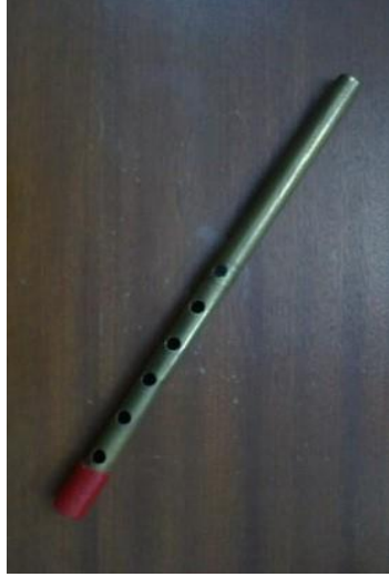
آلة الشبابة ( تشببت )

مجلة علوم وفنون الموسيقى – كلية التربية الموسيقية - المجلد الرابع والأربعون – يناير ٢٠٢١م